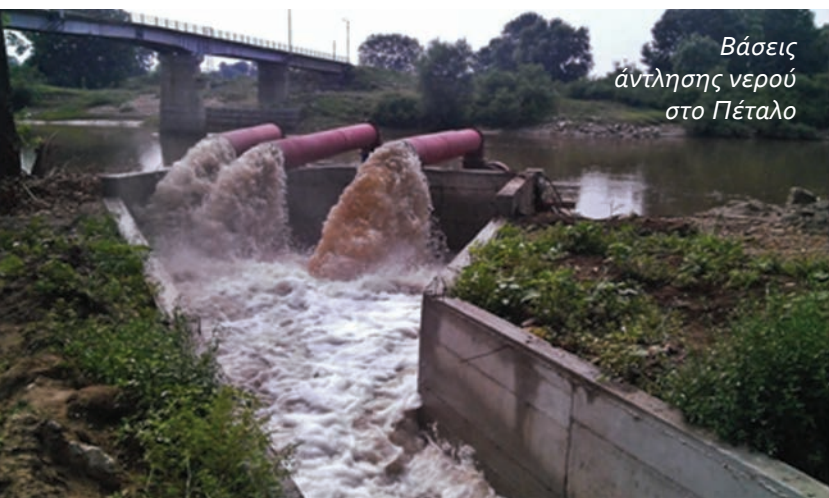
Βάσεις άντλησης νερού στο Πέταλο

Την σύνταξη μελέτης για το αγρόκτημα Γεμιστής